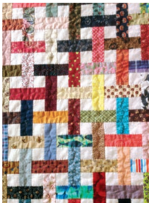
✂ Quiltshop Vlijtig Liesje