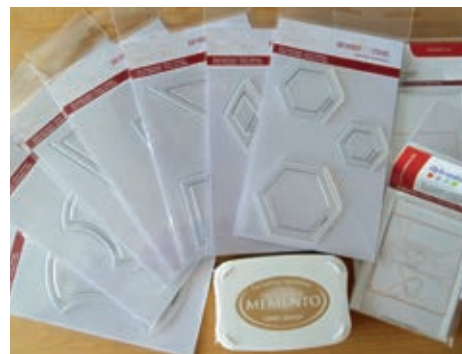
✂ Hobby Time