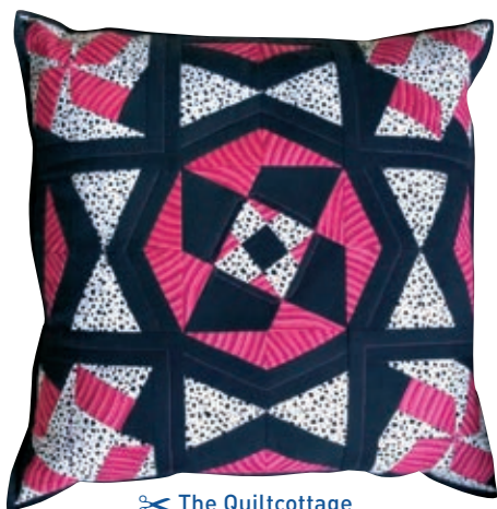
✂ The Quiltcottage