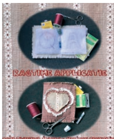
✂ Quiltwinkel Marij

[ www.quiltersgilde.nl ] en Facebook [quilts in Deventer]