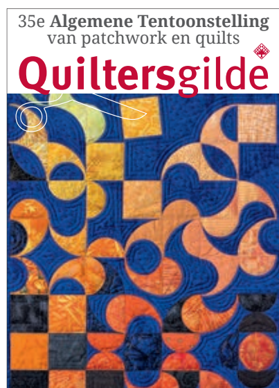
Thema: 'Vlieg met me Mee'

IN DE GROTE OF LEBUÏNUSKERK TE DEVENTER VAN DONDERDAG 6 TOT EN MET ZONDAG 9 SEPTEMBER 2018