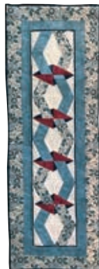
✂ The Quiltcottage

Gedurende de openingstijden van de tentoonstelling vinden er workshops en demonstraties plaats. De demonstraties zijn gratis, voor de workshops wordt [soms] een vergoeding gevraagd. Raadpleeg de website van het Quiltersgilde en de Facebookpagina Quilts in Deventer voor de meest actuele informatie.